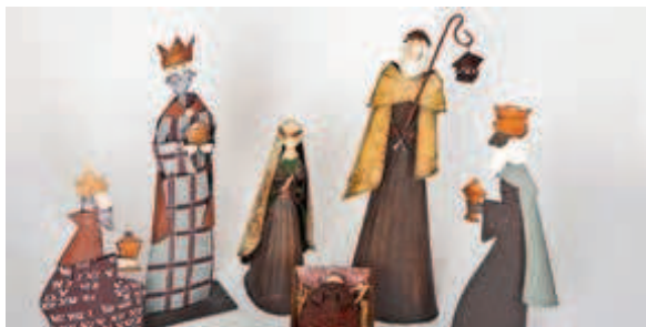
Metallkrippe mit heiligen drei Königen

schen aller Nationalitäten eingeladen sind, ihre eigene Krippe zu bauen. Einzelne Exponate werden im Schaufenster präsentiert.