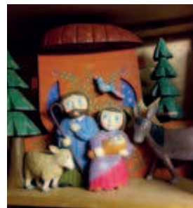
Geschnitzte Holzkippe des Künstlers Henryk Graczyk

AUFSTELLUNGSZEIT: 28.11.2015 bis 06.01.2016